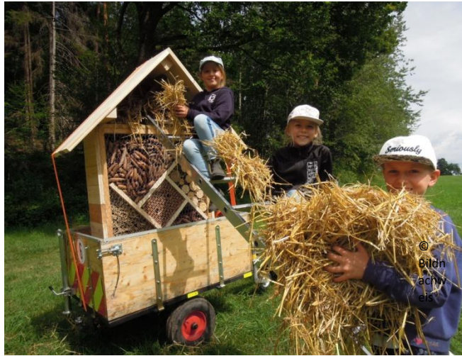
Wochenprojekt: Insektenhotel im Zeltlager 2019